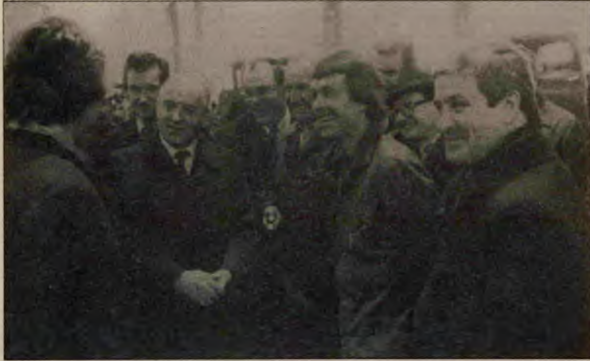
Gorbaçov yoldaş yığınlarla bağ kurmada, onlara seslenmede üstün bir başarı gösteriyor.

"Ülkenin geriliği nedeniyle Sovyetler Birliği proletarya diktatörlüğü altında teoride öngörülmemiş bir aşama yaşadı. Biz buna ülkenin bütünü açısından 'biçimsel sosyalizm aşaması' diyebiliriz. Bu aşama, sosyalizmin koşulu olan üretim güçlerini yaratma kavgasıyla geçti. Şimdi Sovyetler Birliği yavaş yavaş istenen üretim güçleri düzeyine çıkıyor, çadırın içi kalabalıklaşıyor." (agy, s.99-101) (abç)