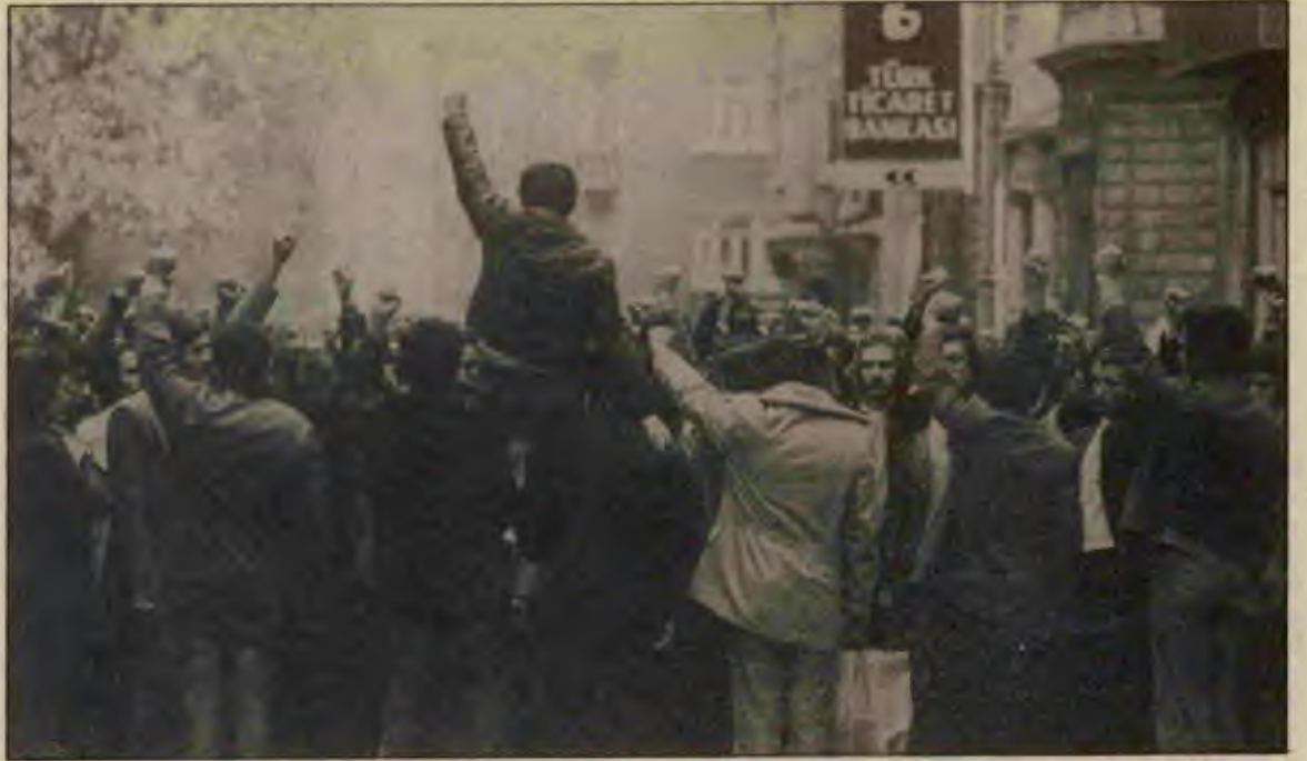
Alanlar gene dolacak.

Bu arada YÖK boş durmuyor. Eleştirilere karşı ne denli duyarlı